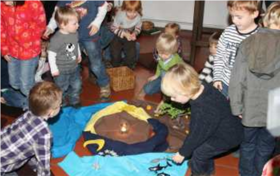
Mit viel Fantasie und Freude spielen Kinder im Familiengottesdienst am 6.2. die Schöpfungsgeschichte nach.