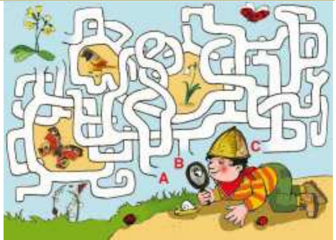
Illustration: Christian Badel

Der Montag vor Aschermittwoch wird auch Rosenmontag genannt. Was hat der Rosenmontag eigentlich mit Rosen zu tun? Denn beim Umzug werden ja keine Rosen, sondern höchstens Karmellen unter die Narrenschar geworfen. Die Rose zu Rosenmontag hat vermutlich etwas mit dem weniger bekannten