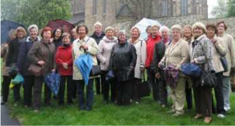
2010 stand ein Ausflug zum Kloster Marienberg auf dem Programm des Mütterkreises.

Der "Mütterkreis" wurde 1971 ins Leben gerufen. Er feiert in diesem Jahr sein 40jähriges Jubiläum.